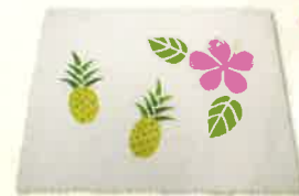
ステンシル染め体験(約A5サイズ)