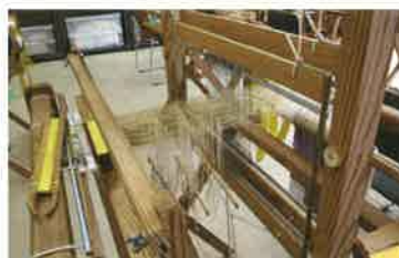
糸綜絢を増やした織機