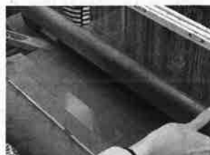
写真は織り作業のイメージです。

機織り機に帯地と同様の絹糸をかけ、幅36cmの首里花織を手投げ杼で約10cm実際に織ってみるプログラムです。講師役の組合員がついていきますので、初めての方でも安心。織り上げた布は小物を作ったり、額装したりしてお楽しみください。