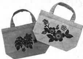
写真はトートのイメージです。

お好きなバッグとびんがたデザインをお選びいただき、あらかじめ型置きしたバッグに色置き・刷り込み・隈取りを行う体験プログラムです。色が定着してから、ご自宅で水洗いして糊を落としていただき、完成。価格はいずれもオープン記念特価!